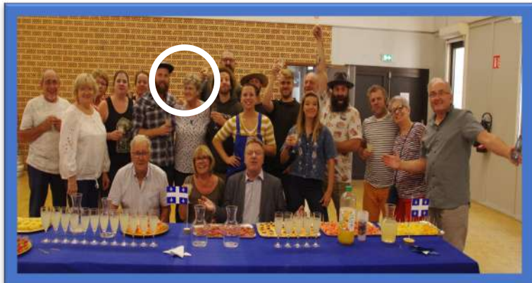
Monique et le Cirque Alfonse – Septembre 2019