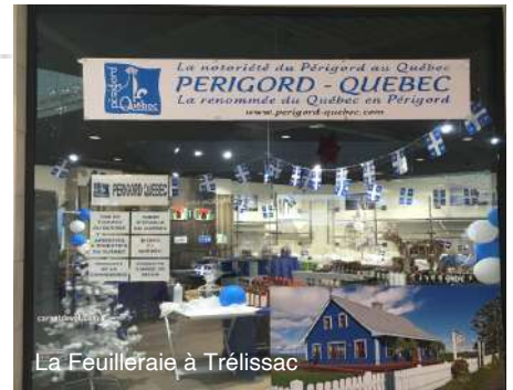
La Feuilleraie à Trélissac