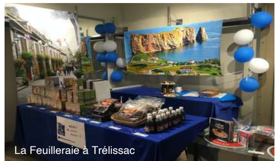
La Feuilleraie à Trélissac