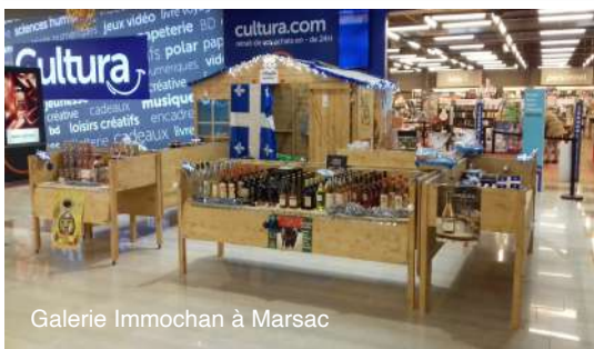
Galerie Immochan à Marsac