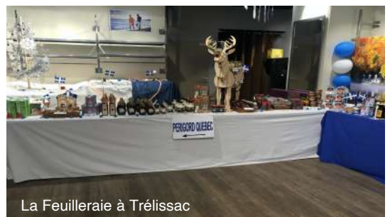
La Feuilleraie à Trélissac