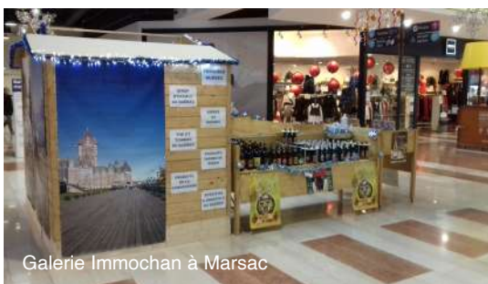
Galerie Immochan à Marsac