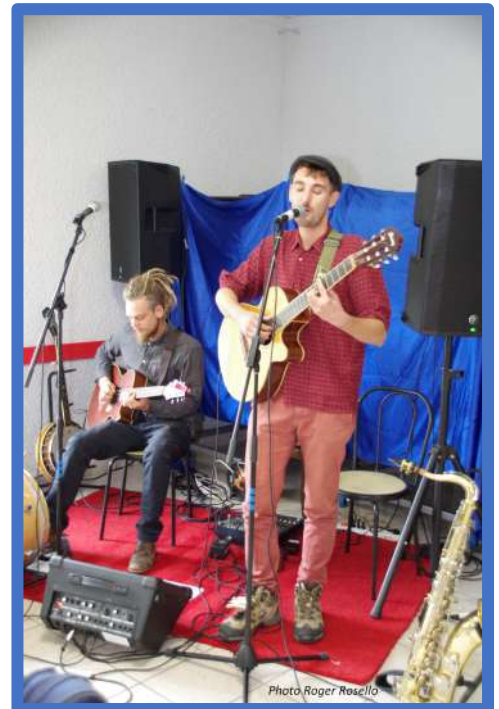
Groupe musical « Le Bon vieux temps »